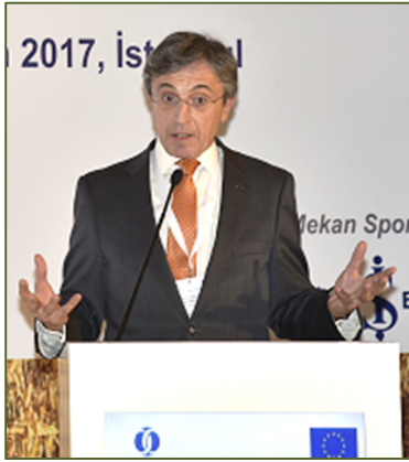
Türkiye İş Bankası Yönetim Kurulu Başkanı Ersin Özince

Uzmanlar ayrıca bundan sonraki süreçte Türkiye'deki tarımsal işletmelerin ve finans kuruluşlarının bu alanlarda gerçekleştireceği projelerle ilgili de somut örnekleri katılımcılarla paylaştı.